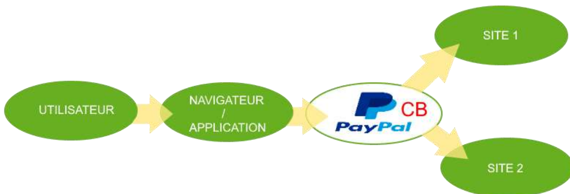
Schéma d'une transaction AVEC Paypal