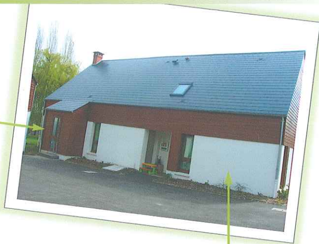
Le logement de la gouvernante

La salle de convivialité offre des animations aux résidents avec, parfois, la participation des habitants du village.