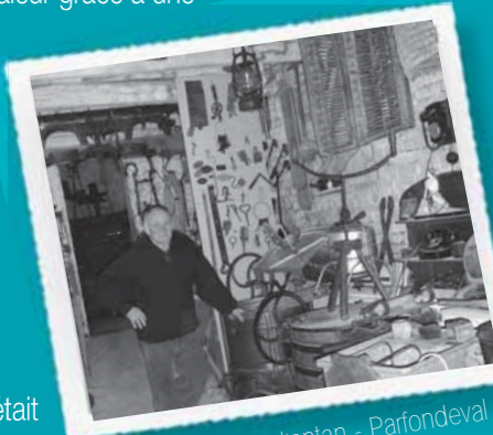
Maison des outils d'antan - Parfondeval