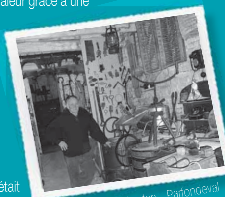
Maison des outils d'antan - Parfondeval