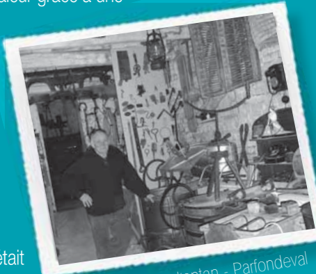
Maison des outils d'antan - Parfondeval