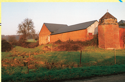
Ferme à Chéry-les-Rozoy