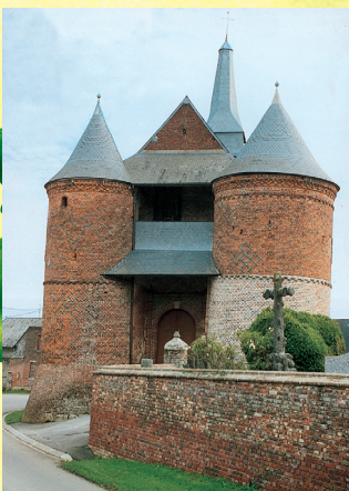
Église fortifiée d' Archon