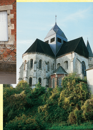
Église fortifiée de Rozoy-sur-Serre