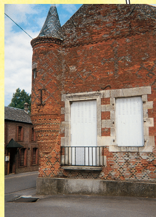
Maison du Bailli à Rozoy-sur-Serre

Deze zwerftocht door de Thiérache biedt u een uniek uitzicht over de vallei van de Serre met in de verte het dorp Rozoy-sur-Serre met zijn leistenen daken rondom de majestueuze Saint-Laurent kerk en de wijk van het Kapittel met huizen uit de 17e en 18e eeuw. In Chéry-les-Rozoy ziet u een boerderij met gesloten hof en een achthoekige duiventil daterend uit het eind van de 18e eeuw. Voorbij de molen van Pont du Rieux steekt u het riviertje over via het bruggetje of wadend door het water.