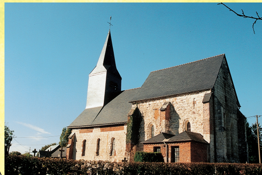
Église de Sainte-Geneviève

Omzoomd door bomen en struiken, volgt het pad het kronkelige riviertje de Serre, dat u leidt naar het kerkje Sainte Geneviève waarvan opvallend dat het koor, daterend uit 13e eeuw, hoger is dan het schip. De wandeling door het vredige dorpje in de vallei van de Serre geeft u een mooi beeld van het landschap van de Thiérache, bebost met appelboomgaarden.