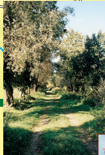
Sentier à Sainte-Geneviève