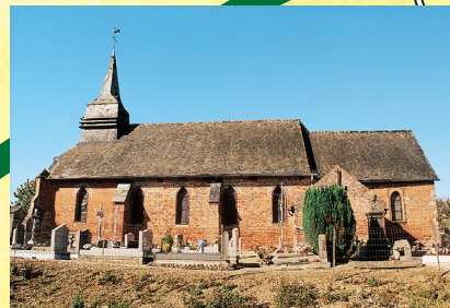
Église de Magny